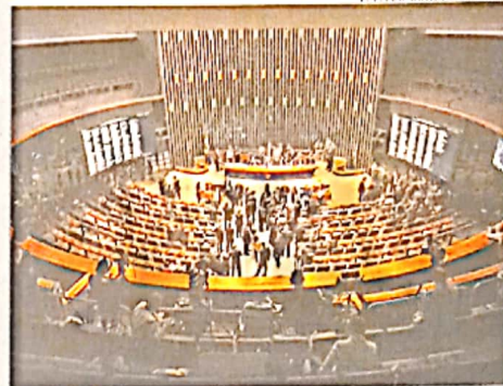
LA PRIMERA DE LAS TRES SESIONES EN QUE SE DECIDIRÁ EL JUICIO POLÍTICO.

Tanto las fuerzas que respaldan al Gobierno, como las de la oposición, dicen tener suficientes votos para ganar mañana, pero